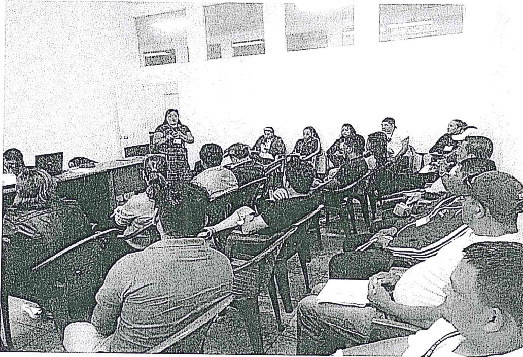
APOYO EN EL TALLER DE PROMOTORES.